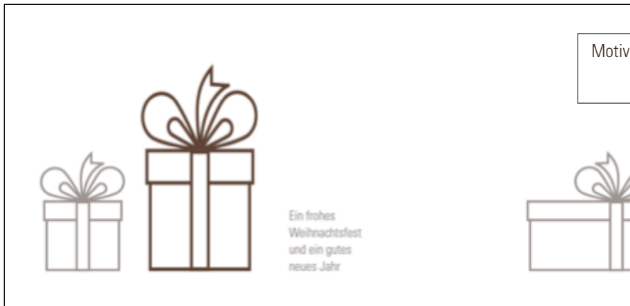
Motiv: Päckchen Vorderseite